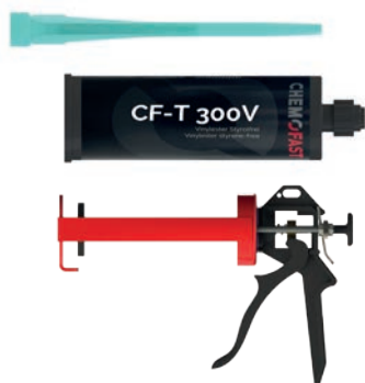
Verbundmörtel und Zubehör