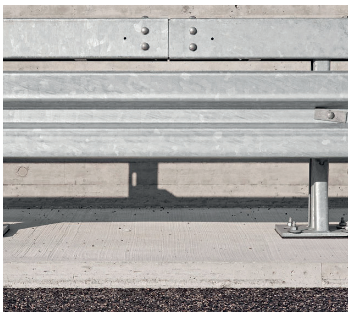
Befestigung von Fahrzeugsleitsystemen